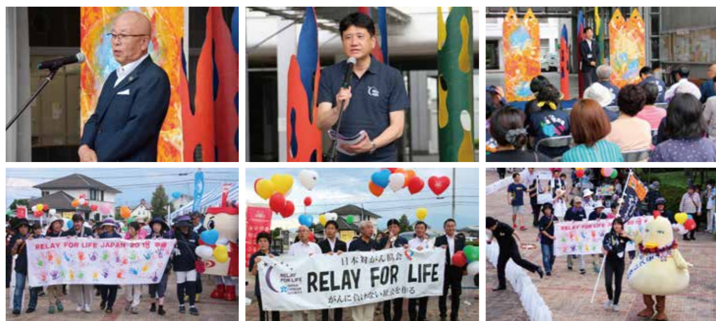
がんサバイバー（がん経験者）の方々を先頭に、リレーウォークのスタートです!!