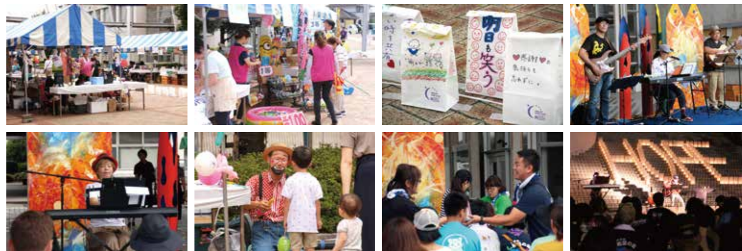
会場内では、色々なお店が並び、多彩なパフォーマンスが行われます。

今後もこの使命を胸により良い活動を進めていきたいと考えています。引き続き皆様の変わらぬご支援、ご協力よろしくお願い申し上げます。