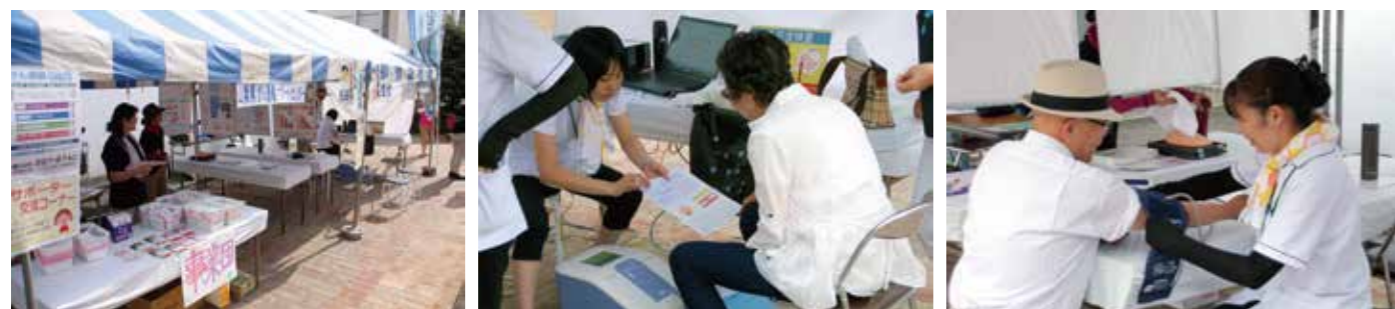
当事業団のブースにも、大勢の方々に越しいただきました。