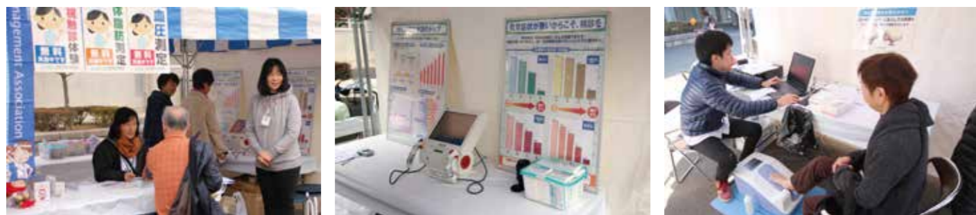
以前実施時の事業団ブースの様子