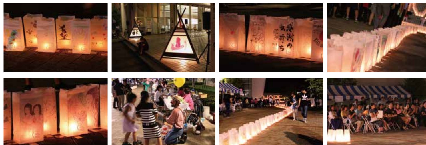
夜間も美しいルミナリエに照らされながら、イベント会場は眠ることはありません。