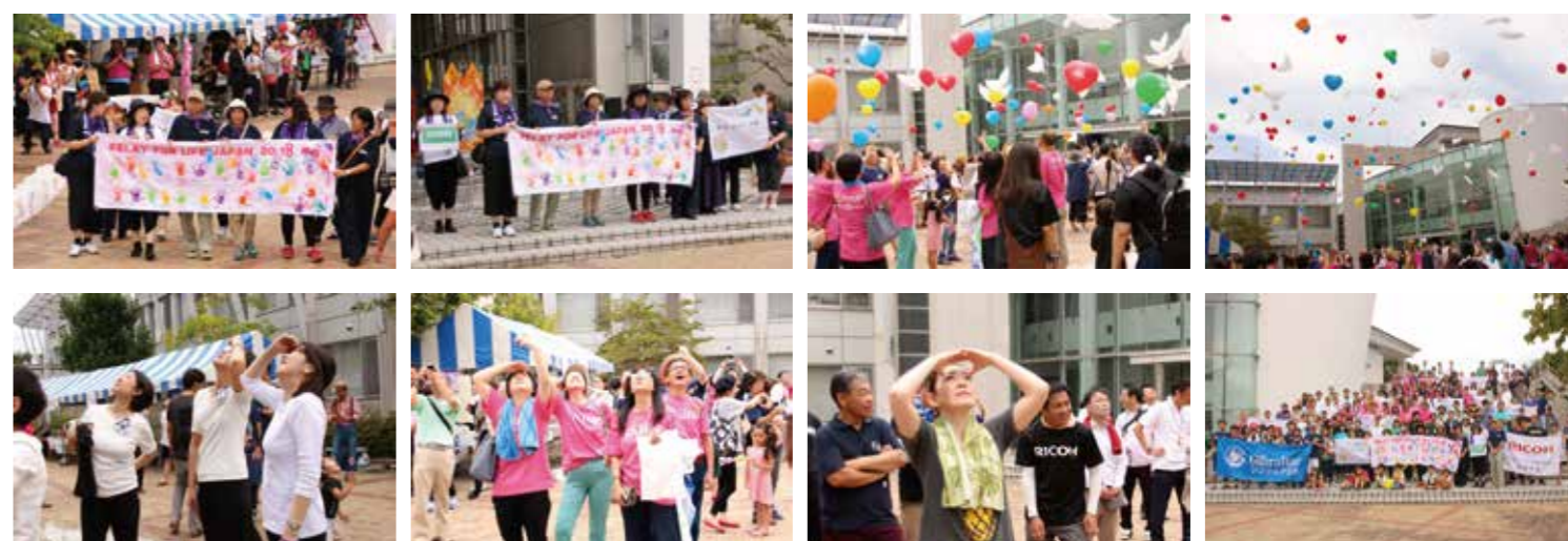
一夜明け、青空のもと無事に閉会式を迎えることができました。

多くの皆様のご協力、誠にありがとうございました。 2019年もよろしくお願いいたします。